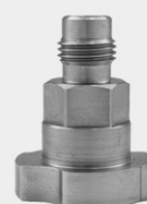
Adapter Nr.: 87 Iwata Pininfarina WS400/LS400 Evo